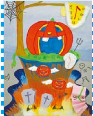
姓名：陳樂庭 班別：P.6B 主題：萬聖節