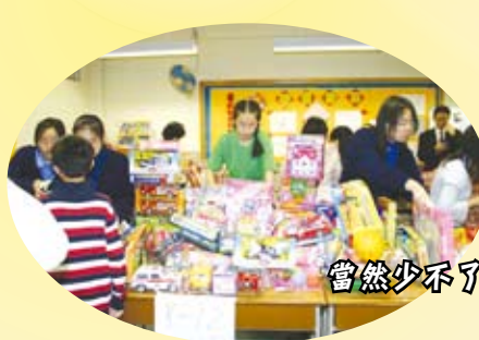
當然少不了換禮物！