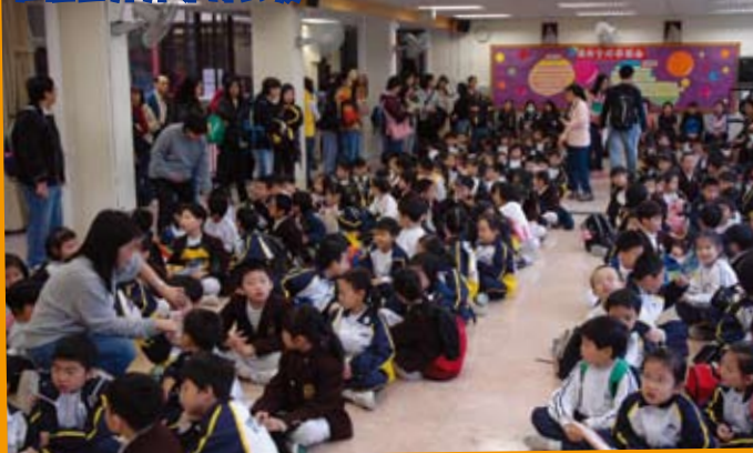
在禮堂齊齊等待出發！