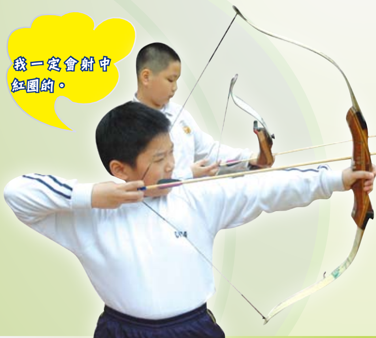
我一定會射中紅圈的。