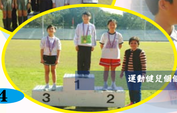
運動健兒個個「醒」，囊括獎牌無得頂！