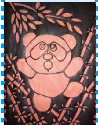
姓名：陳瑄涓 班別：P.5C 主題：熊貓