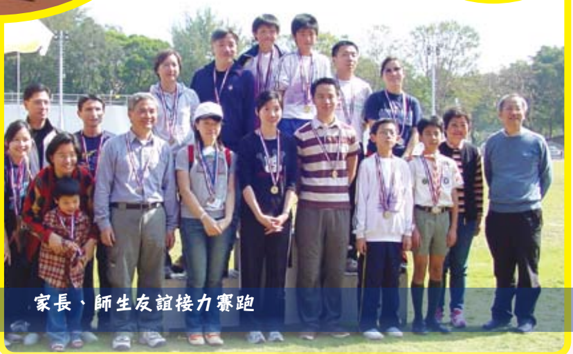
家長、師生友誼接力賽跑