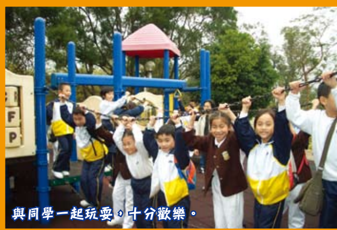
與同學一起玩耍，十分歡樂。