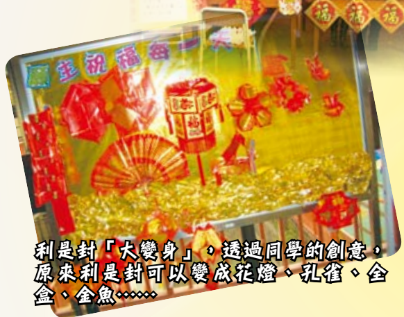
利是封「大變身」，透過同學的創意，原來利是封可以變成花燈、孔雀、金盒、金魚……