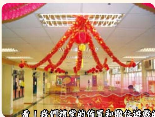
看！我們禮堂的佈置和攤位遊戲的設計，都充滿節日的氣氛。