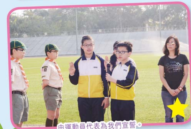
由運動員代表為我們宣誓。