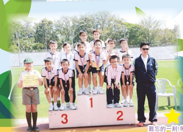
難忘的一刻!等到了!多威風!