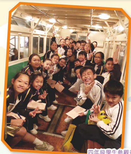
四年級學生參觀香港歷史博物館。