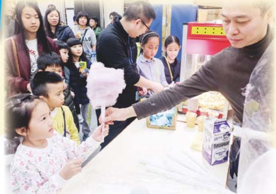
叔叔，我想要加大的提子味棉花糖，可以嗎？