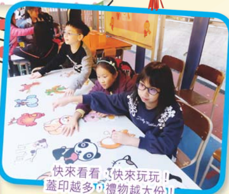
快來看看，快來玩玩！ 蓋印越多，禮物越大份！！