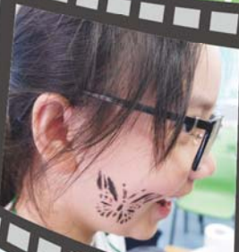
我的蝴蝶多美啊！！我的恐龍也很威武啊！