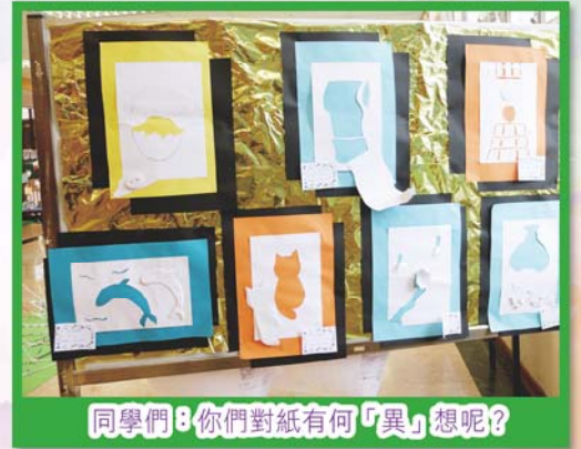
同學們：你們對紙有何「異」想呢？