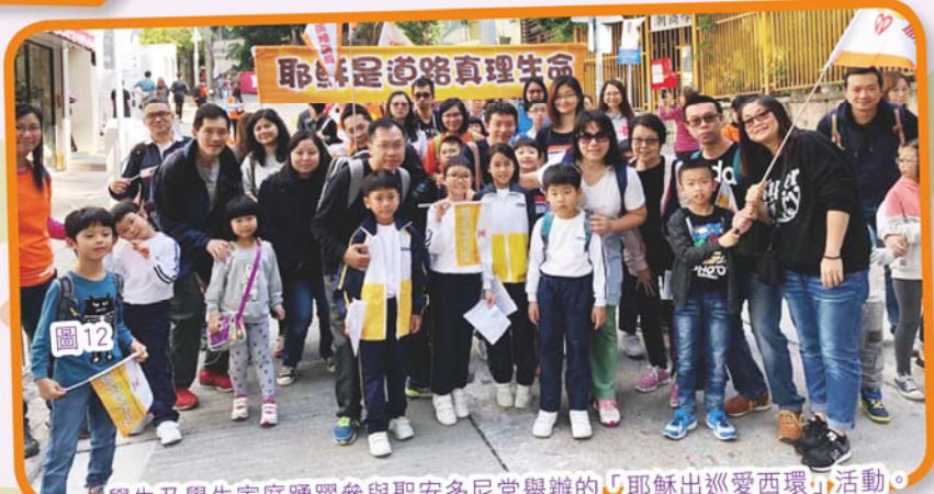
學生及學生家庭踴躍參與聖安多尼堂舉辦的「耶穌出巡愛西環」活動。