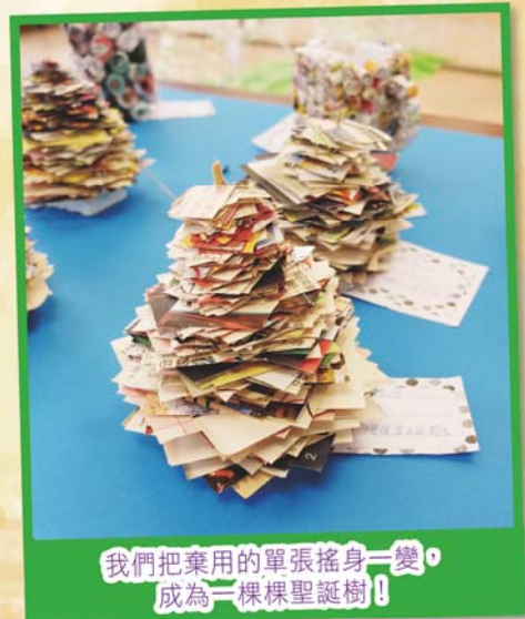
我們把棄用的單張搖身一變，成為一棵棵聖誕樹！