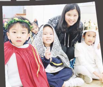
「聖火CatWalkshow」◦猜猜我扮演哪一位聖人？