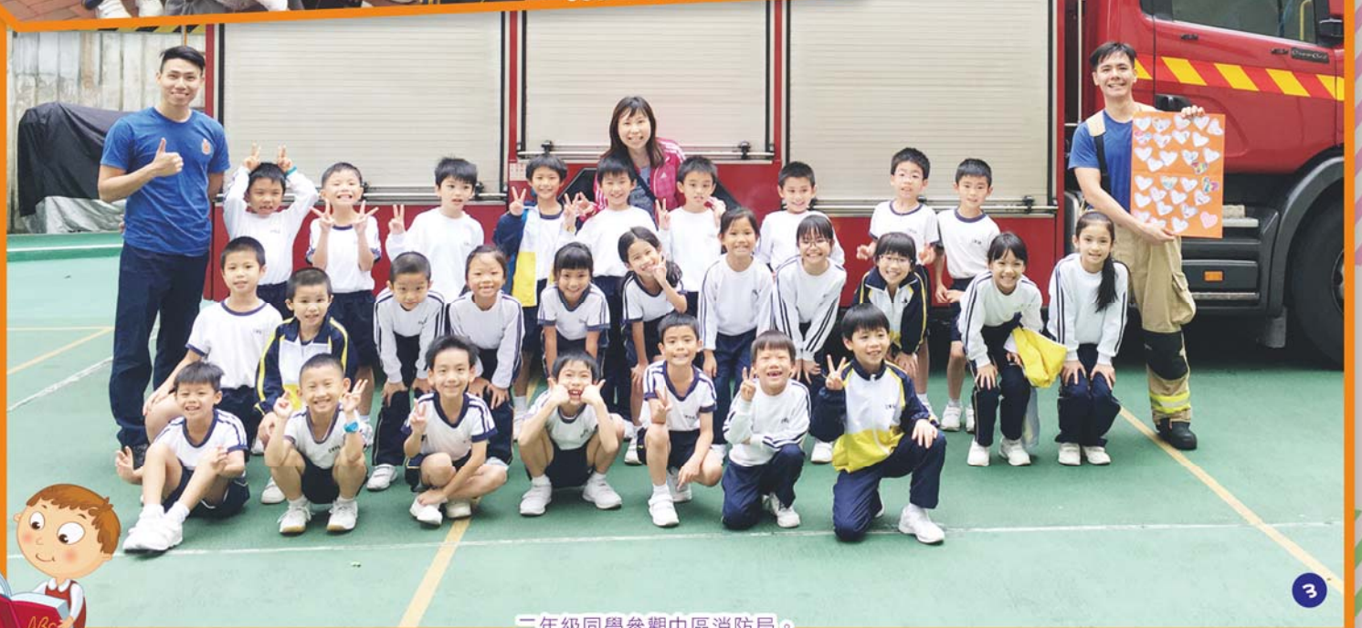
三年級同學參觀中區消防局。