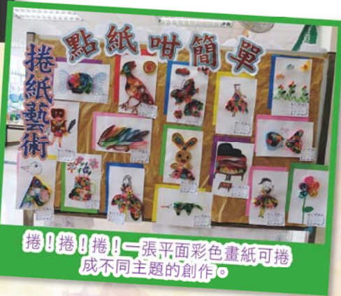
捲！捲！捲！一張平面彩色畫紙可捲成不同主題的創作。