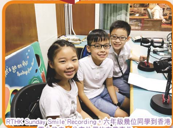
RTHK Sunday Smile Recording。六年級幾位同學到香港電台錄音，分享他們的有趣事件。