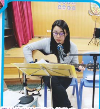
霍姑娘特地回來為籌款出一分力， 她的歌聲悅耳動聽，繞樑三日。