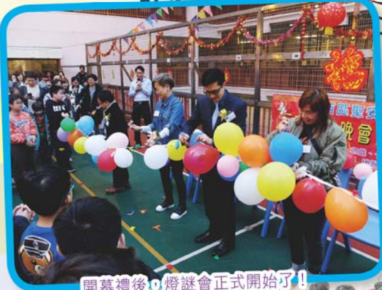
開幕禮後，燈謎會正式開始了！

三月九日是本校一年一度的燈謎晚會，家長、校友、同學和老師聚首一堂，度過了一個愉快的晚上。