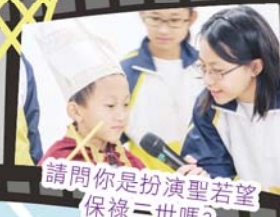
請問你是扮演聖若望保祿三世嗎？

今年度的慶禮院活動日，節目相當豐富！全校老師和同學們都玩得十分盡興！大家都非常期待明年慶禮院活動日的來臨。