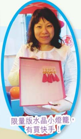
限量版水晶小燈籠， 有買快手！