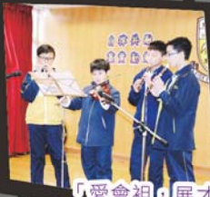
「愛會祖◦展才能」，我們組織了小型樂隊◦有人伴奏◦有人唱歌◦真是繞梁三日！