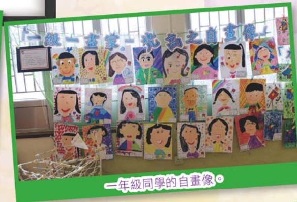
一年級同學的自畫像。