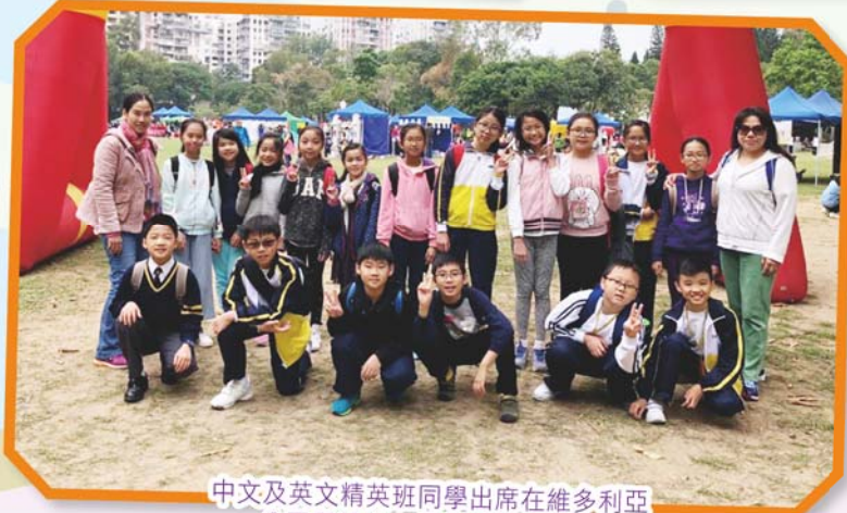
中文及英文精英班同學出席在維多利亞公園舉行第29屆閱讀嘉年華。