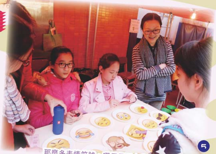
那麼多表情符號，哪個最配合我呢？