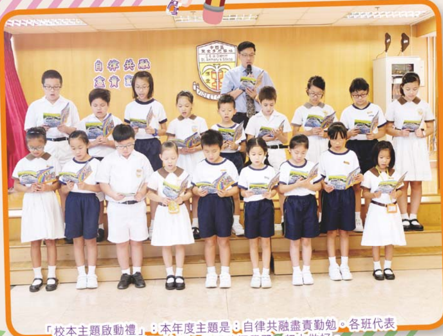
「校本主題啟動禮」：本年度主題是：自律共融盡責勤勉。各班代表在校長帶領下宣誓，承諾積極學習，努力做好。