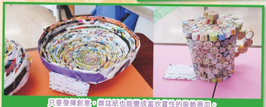
只要發揮創意，雜誌紙也能變成富欣賞性的裝飾器皿。