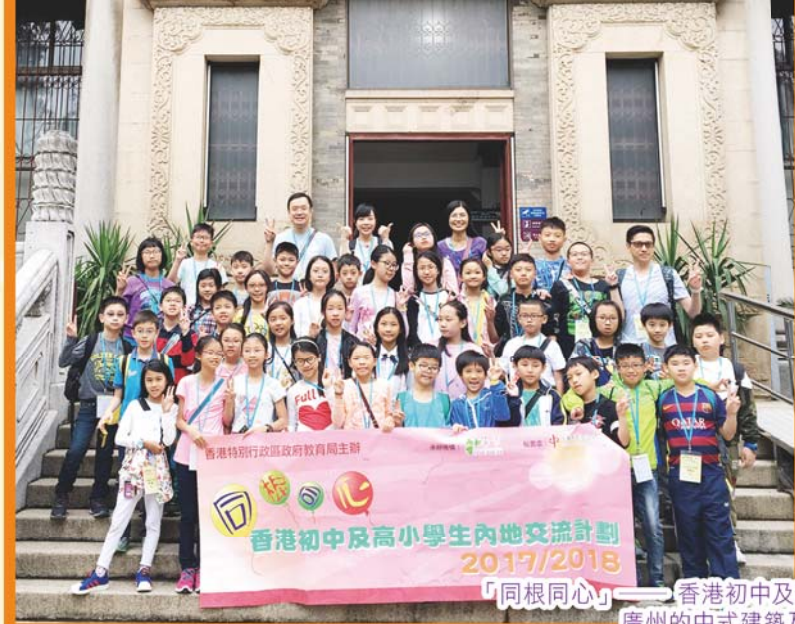
「同根同心」——香港初中及高小學生內地交流計劃 (2017/18) 廣州的中式建築及其歷史文化兩天遊。