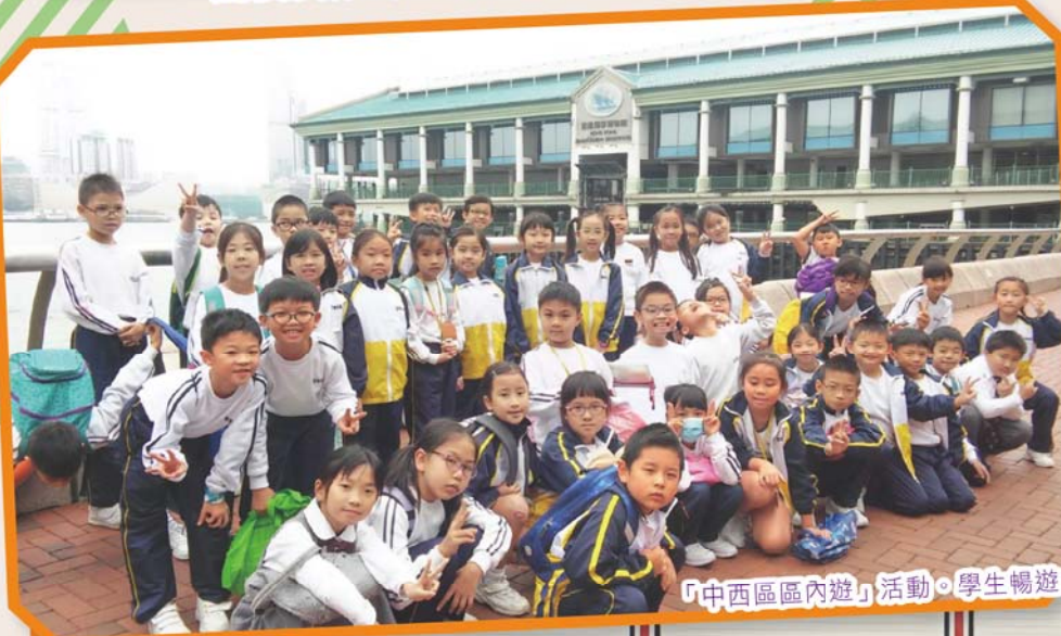
「中西區區內遊」活動。學生暢遊中西區，了解我們社區的特色。