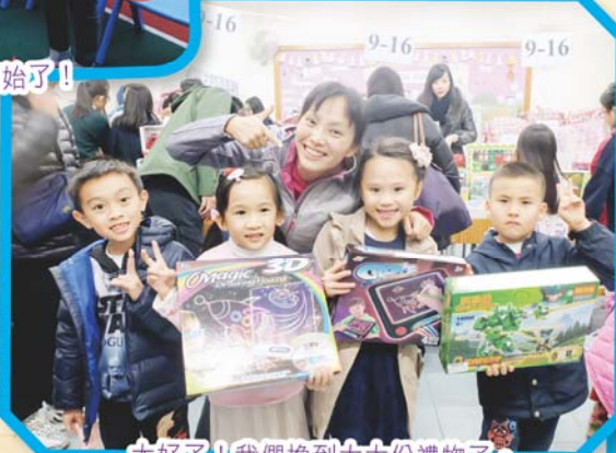
太好了！我們換到大大份禮物了。