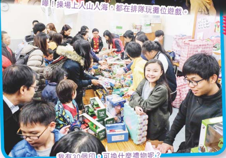
我有30個印，可換什麼禮物呢？