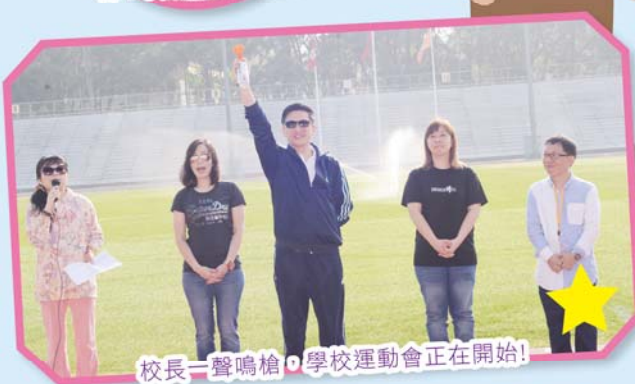
校長一聲鳴槍，學校運動會正在開始!