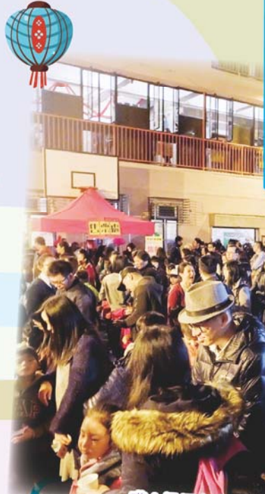
嘩！操場上人山人海，都在排隊玩攤位遊戲。