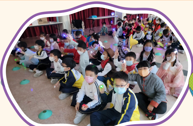
同學都用心欣賞台上的服飾秀表演。