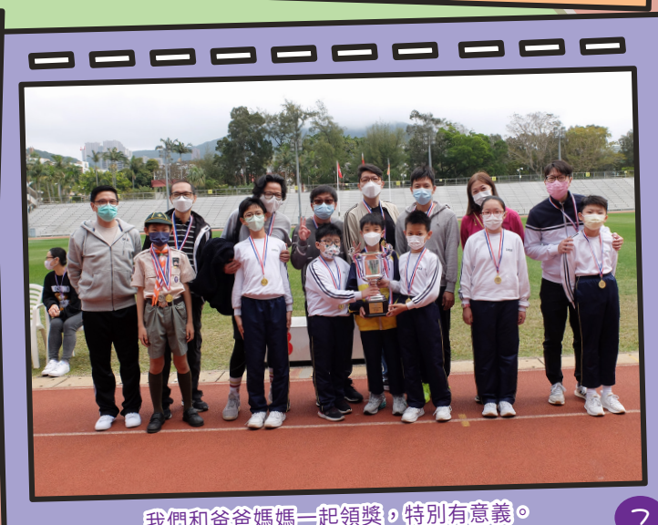
我們和爸爸媽媽一起領獎，特別有意義。