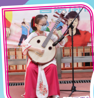
同學即席表演中院《早天雷》