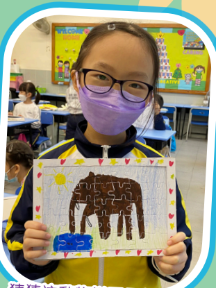
猜猜這動物拼圖是甚麼?