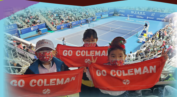
同學出席「香港網球挑戰賽導賞活動」，大開眼界！