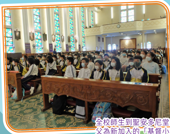
全校師生到聖安多尼堂慶祝聖母無原罪瞻禮，神父為新加入的「基督小先鋒」成員送上祝福。