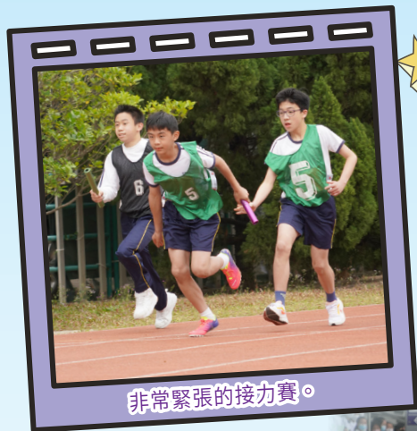
非常緊張的接力賽。