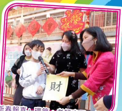
「新春報喜」環節，老師出示一個字，同學就想出一句和這個字有關的恭賀語句。