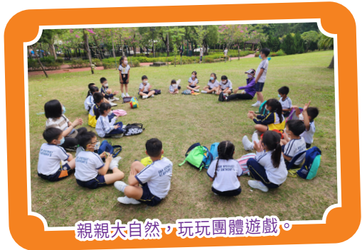
親親大自然，玩玩團體遊戲。