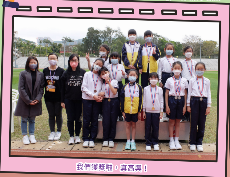
我們獲獎啦，真高興！