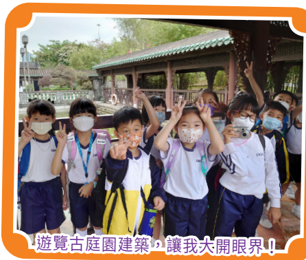
遊覽古庭園建築，讓我大開眼界！