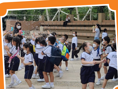
漫天彩虹泡泡，我們很開心呢！