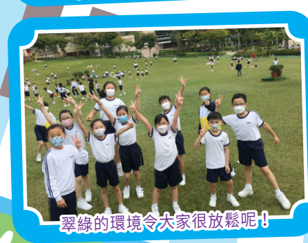
翠綠的環境令大家很放鬆呢！