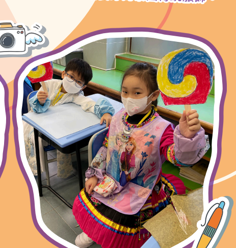
看!我的太極扇多美!