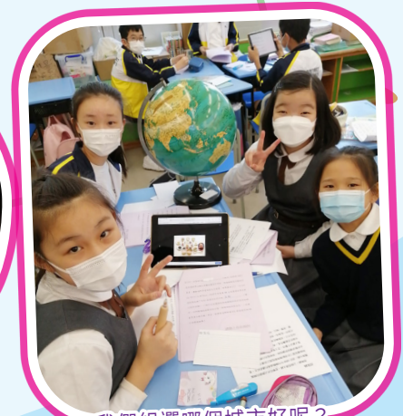
我們組選哪個城市好呢？