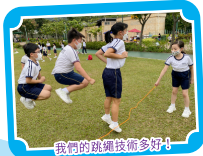
我們的跳繩技術多好！