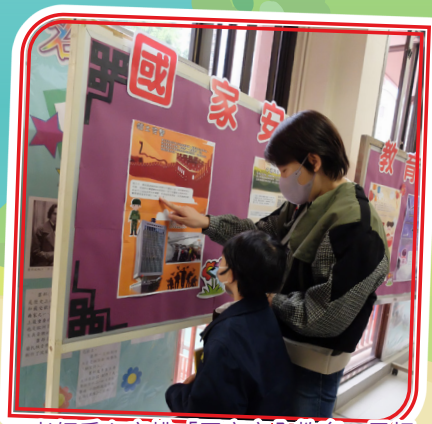
老師悉心安排「國家安全教育」展板，讓家長及學生一起參與有獎問答遊戲。