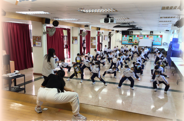
我們在跟導師學習韓國的流行舞蹈——KPOP。