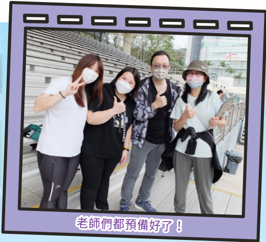
老師們都預備好了！