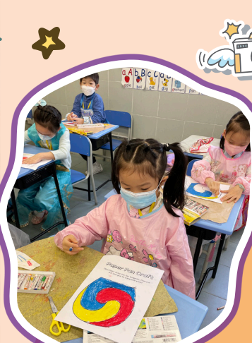
學生用心製作太極扇。