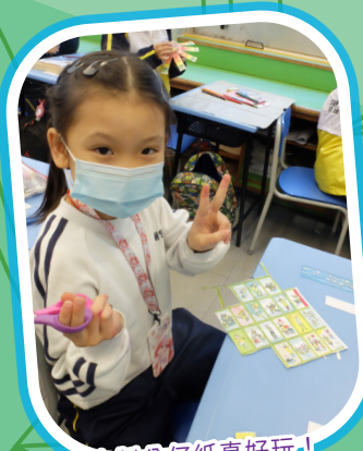
自製公仔紙真好玩!