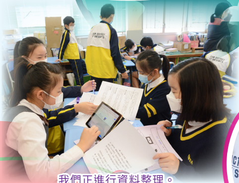
我們正進行資料整理。