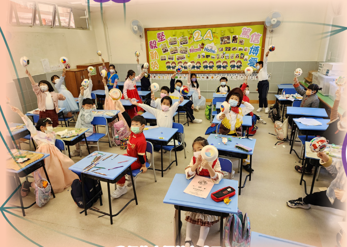
我們的太極鼓完成了!