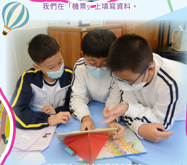
我們選定了所介紹的城市資料。