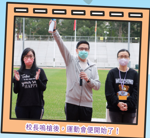
校長鳴槍後，運動會便開始了！