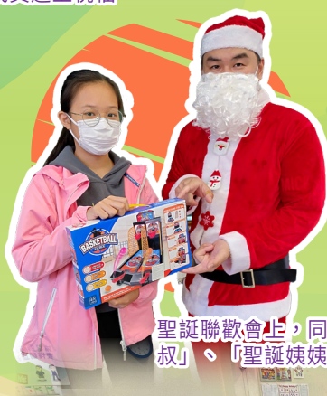
聖誕聯歡會上，同學們在玩集體遊戲。「聖誕叔叔」、「聖誕姨姨」進入課室為學生送上禮物。