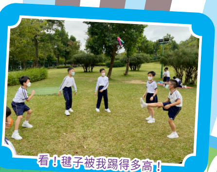
看！毬子被我踢得多高！