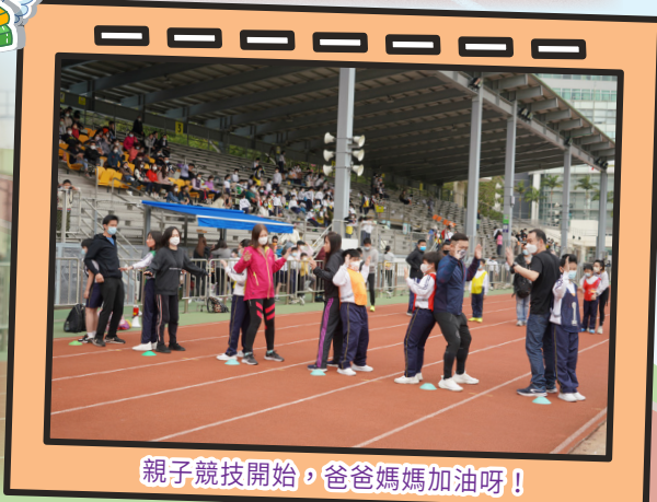
親子競技開始，爸爸媽媽加油呀！