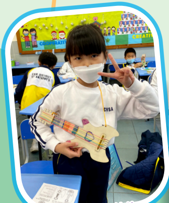
自製墨西哥小結他。