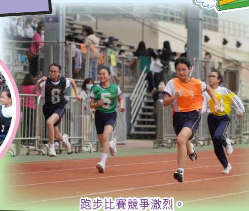
跑步比賽競爭激烈。