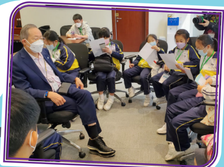
「校園小记者」訪問立法會議員黎棟國議員。