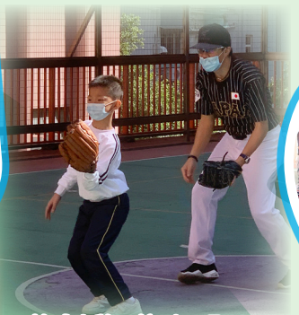
棒球小將，接到了嗎?