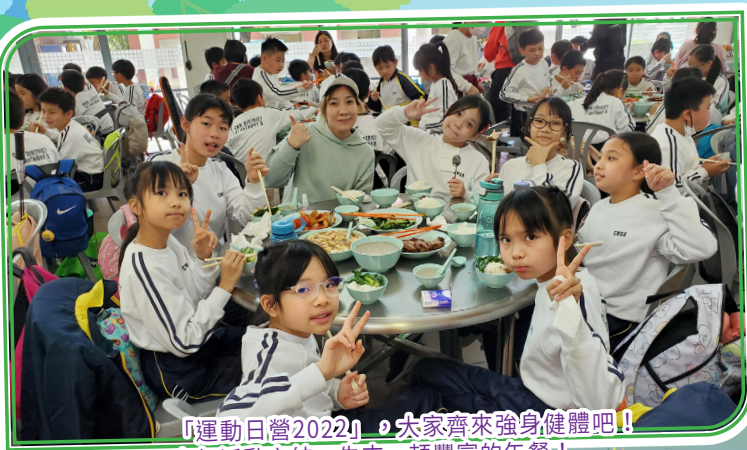
「運動日營2022」，大家齊來強身健體吧！ 上午活動完結，先來一頓豐富的午餐！