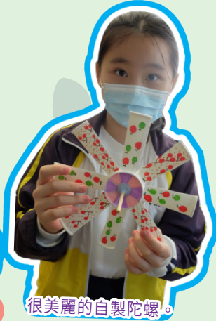
很美麗的自製陀螺。