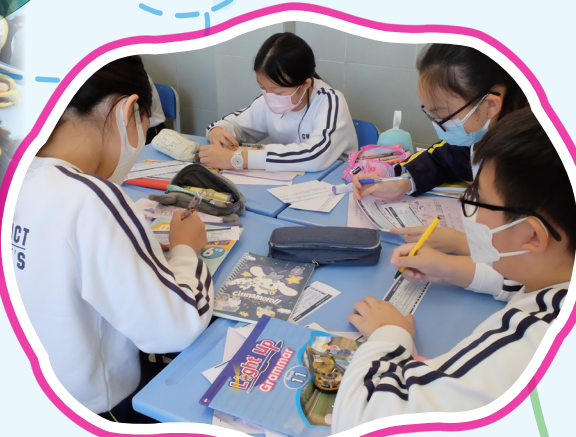
我們在「機票」上填寫資料。