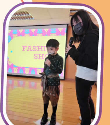
我在台上介紹我穿的泰國傳統服飾。