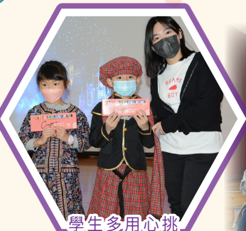
學生多用心挑選參演服飾!