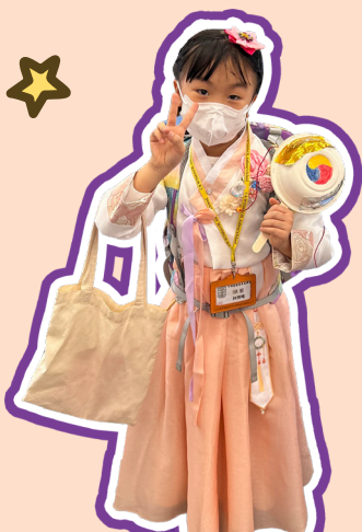
放學了!我這兩天收穫豐富呢!