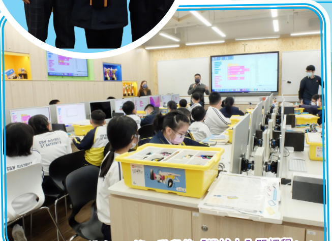
「小學奇趣知識多D」第三階段的「機械人入門課程」，參與同學都專心上課。校長頒發獎品給表現優異的同學。