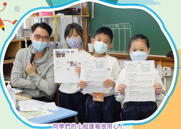
同學們的小組匯報很用心!