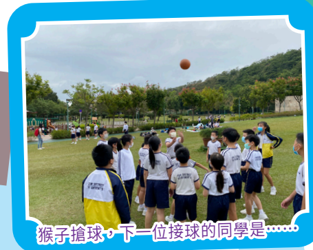
猴子搶球，下一位接球的同學是……