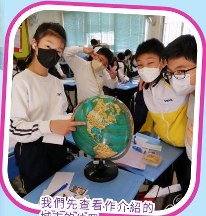
我們先查看作介紹的城市的位置。