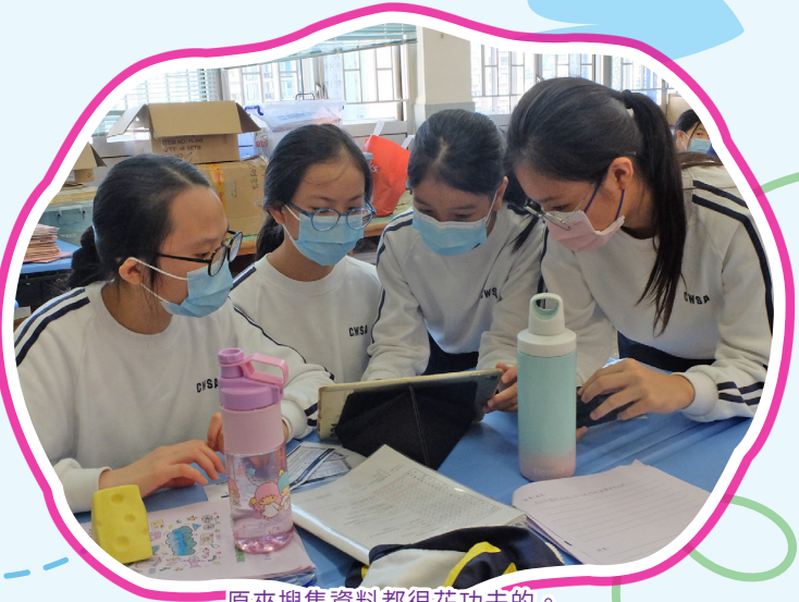
原來搜集資料都很花功夫的。