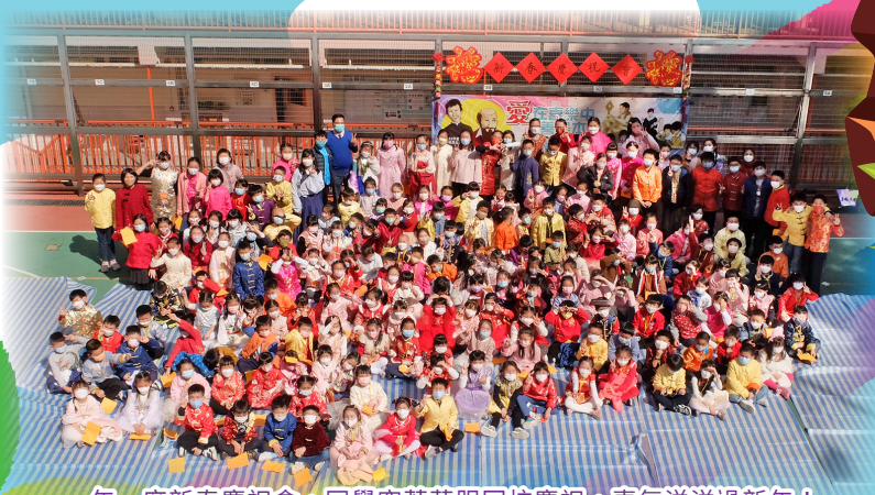
一年一度新春慶祝會，同學穿著華服回校慶祝，喜氣洋洋過新年！