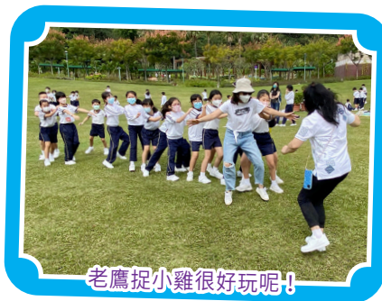
老鷹捉小雞很好玩呢！