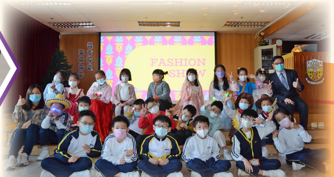
傳統服飾秀完成了!我們很開心!