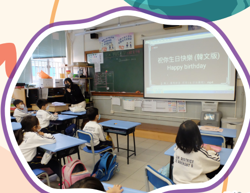
學生在學唱韓文版生日歌。