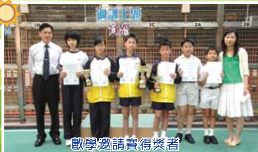
數學邀請賽得獎者