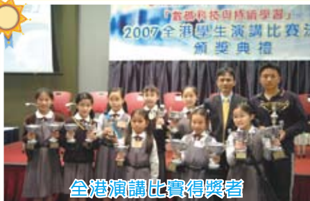
全港演講比賽得獎者