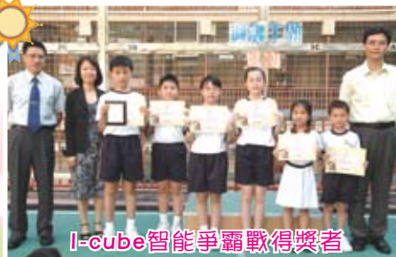
I-cube智能爭霸戰得獎者