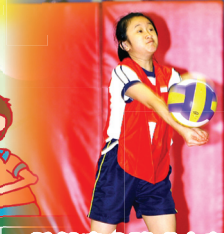
雖然這個球力度很大，但我也要成功把它接過去。