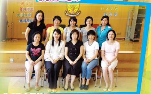
午膳服務家長義工