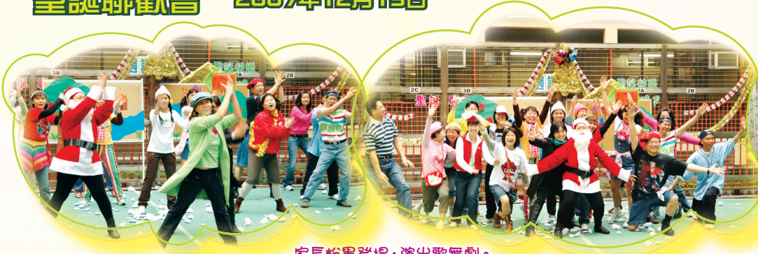
家長粉墨登場，演出歌舞劇。