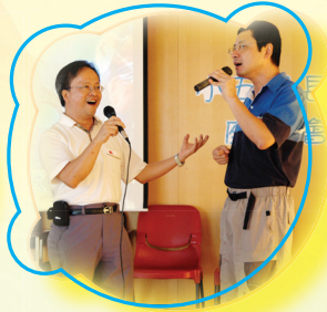
鄧主任和營副主席合唱 一曲·鏗鏘三日!