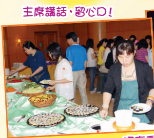
酒店自助餐·食物非常豐富!