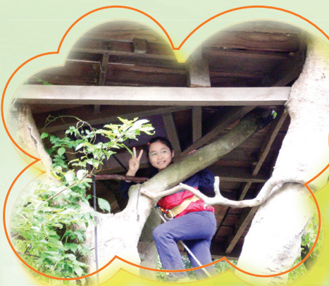
我是一隻精靈的猴子！爬樹多好玩！