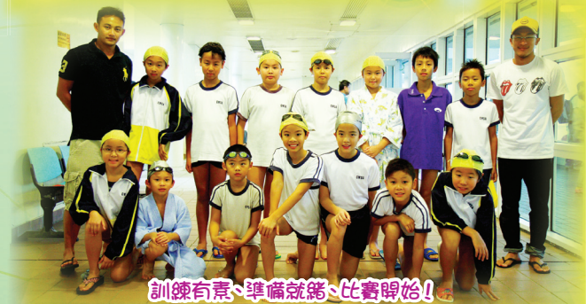
訓練有素、準備就緒、比賽開始！ Go Go Go !!!