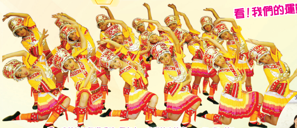
擺一個美妙的舞姿造型，再加上一個甜美的笑容，一、二、三、笑！

羽毛球隊男子組於香港仔呂明才遠信會舉辦的第四屆小學數學暨挑戰盃球類比賽奪得亞軍。