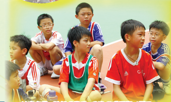
比賽完畢，雖然很累了，但我們還要專心聽取教練的賽後反思呢！