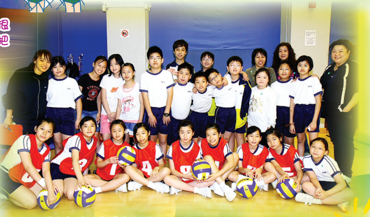
排球隊參加第一年舉辦的港西區學界比賽，先來一張大合照吧！