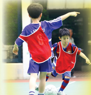
雖然我年紀小小，但我有的是魄力。