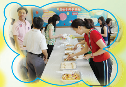
有飲有食有歌聽·真好!