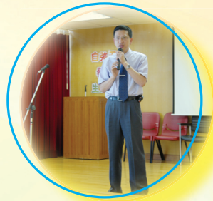
多謝各位家長一年來的幫忙……