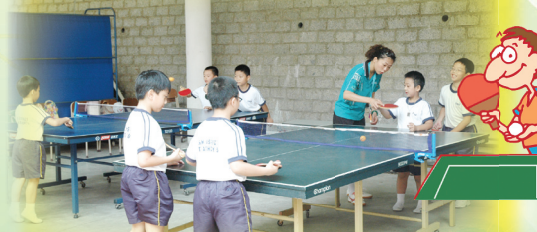
看，乒乓球隊的隊員多認真聽取教練的指導！