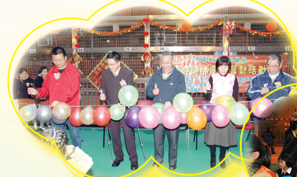
燒炮竹！睇幕啦！快掩耳朵。