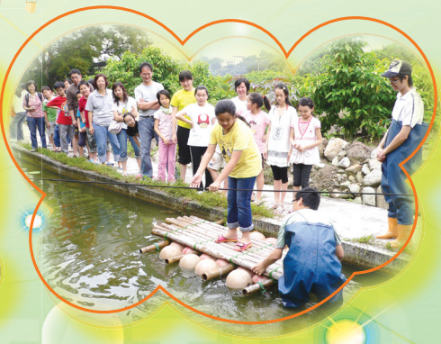
小心點！我吞過水了！