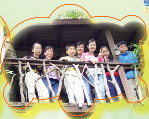
我們在哪裏？樹上的小屋囉！