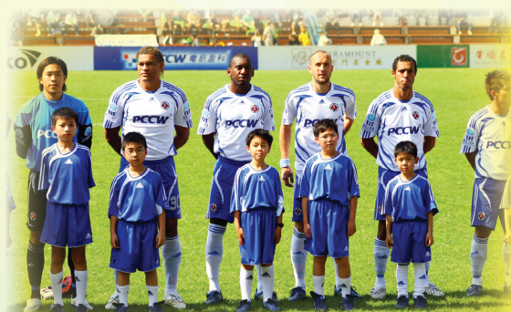
有機會在香港大型的公開賽做球童，和鼎鼎大名的香港甲組隊員合照，真是很榮幸。