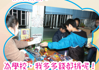
為學校，我多多錢都捐呢！