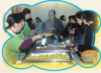
熱騰騰的魚蛋、燒賣，快來換購！