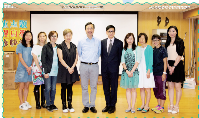
余德淳博士以輕鬆幽默的方式，結合心理學及兒童成長發展理論，為家長提供實用的與孩子相處策略，共建「學習型家庭」。