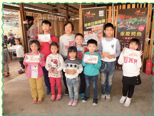
有得食！有得玩！還有抽獎呢！