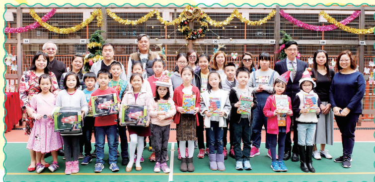
蘇神父、郭校長及各位家教會委員為同學們預備了豐富的抽獎禮物！