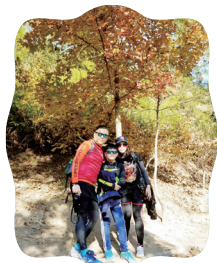
聖誕假期，一家人到元朗大棠遠足、賞紅葉。

劉： 我很感恩兒子很懂事，每天會自動自覺完成功課。而我先生也是於教育界工作的，所以也很明白及體諒我每天工作時間比較長，甚至假期也要回校處理不同的行政工作。但只要為學生的，我覺得再繁忙也是值得的！星期日是我家的家庭日，我會放下手上的工作，跟家人一起度過。長假期時，如果不需要回校工作的話，我們全家會一起出外旅遊或遠足。