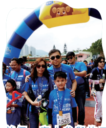
首個一家人參與的三公里賽跑活動——童心跑，既可做善事、又健康，一舉兩得！

劉： 幾年前，學校裡幾位老師相約一起參加渣打馬拉松十公里比賽。我們會相約於星期五放學後一起練習。不經不覺我也參加了四年比賽，最佳紀錄是一小時零五分完成十公里。其他老師越戰越勇，近年紛紛轉為參加「半馬」（註：約二十一公里）比賽，甚至「全馬」比賽。現在只剩下我一個人參加十公里比賽，所以練習也比從前少了。去年我和我先生一起參加渣打馬拉松比賽。不過他跑半馬，我是跑十公里。