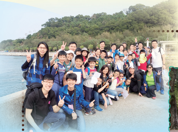
我們一行人，浩浩蕩蕩來到長洲，進行親子歷奇活動，大家都很興奮！