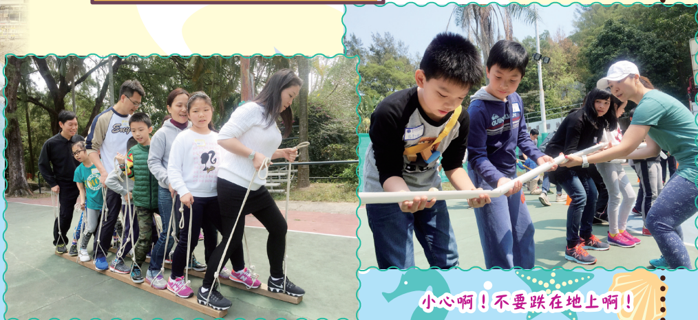
小心啊！不要跌在地上啊！