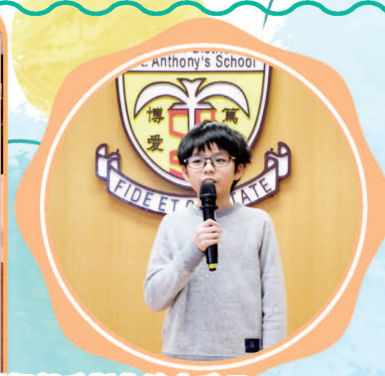
一年一度的家教會及老師聖誕聯歡會，委員預備了抽獎禮物，學生表演，還把親手製作的小手工送給校長，大家盡興而歸！