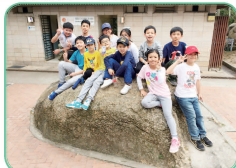
我們是年青新一代，社會未來的主人翁，爸爸媽媽，交棒給我們吧！