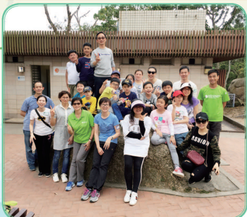
長洲遊！美好的一刻，快把它留住，先來個大合照。