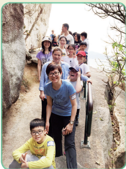
行了一整天，是時候休息一下！