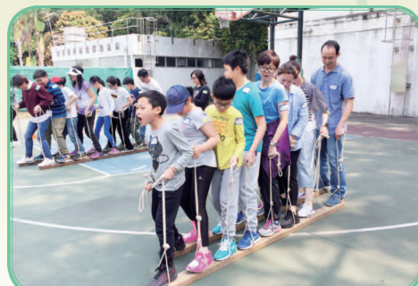
大家預備好，出發！我們八個人，十六條腿，一定走得快！