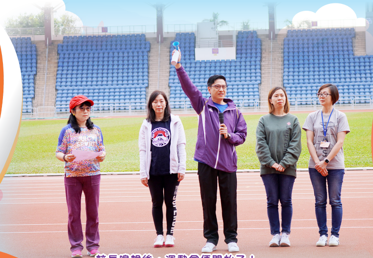
校長鳴槍後，運動會便開始了！