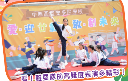
看!! 雜耍隊的高難度表演多精彩!