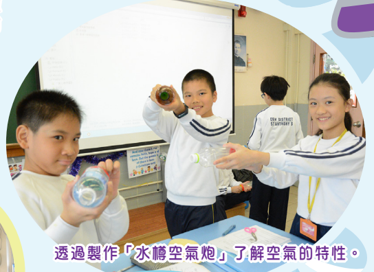
透過製作「水樽空氣炮」了解空氣的特性。