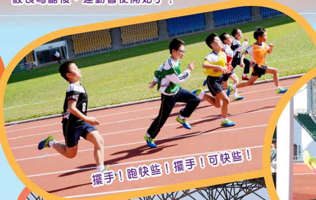
擺手！跑快些！擺手！可快些！