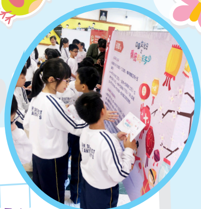
中國文化研究院提供有關中華文化的展板，讓同學對中國傳統的節日有更深入的了解。