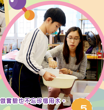
我們做實驗也不忘珍惜用水。