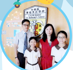
本年度的校本主題是「豐盛正向人生路」，在校長的帶領下，同學們作出承諾，開展豐盛正向的一年。