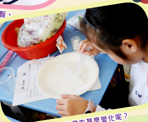
在冰上加鹽後會有甚麼變化呢？