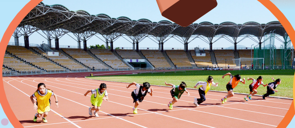
大家都應聲彈出！力爭上游！