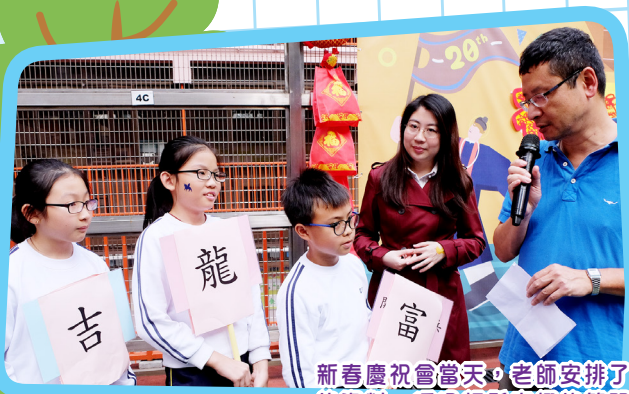
新春慶祝會當天，老師安排了一連串有關節日的資料，透過輕鬆有趣的答問，讓同學對傳統節日加深認識。