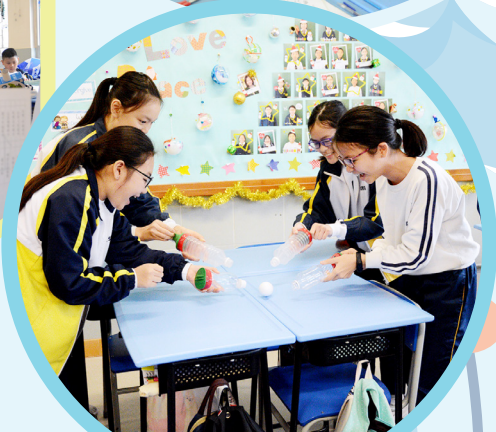
利用「水樽空氣炮」進行足球比賽很有趣呢！