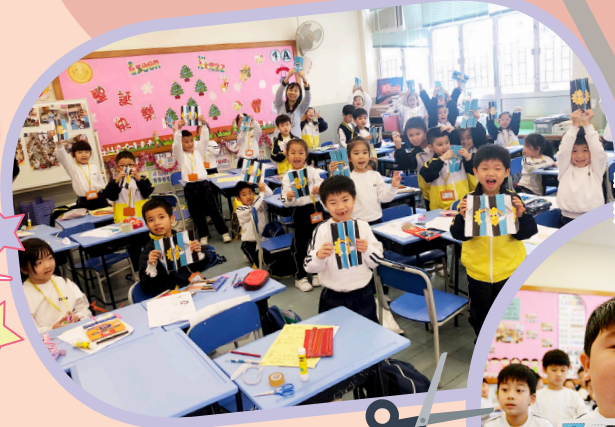
看看我的三合一圖畫製成品。

通過「視錯覺現象」和「視覺暫留」等各種探索實驗，認識科學及科技與自然現象的緊密關係，培養探索興趣、好奇心，以及去偽存真，科學求實的態度。