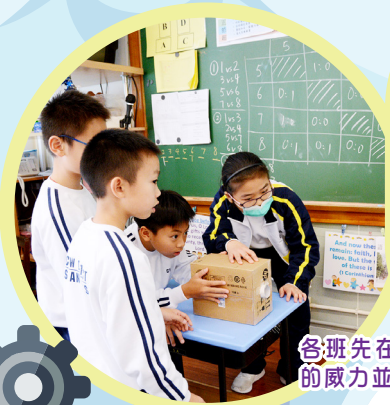
各班先在課室裏測試「空氣箱」的威力並予以改良。