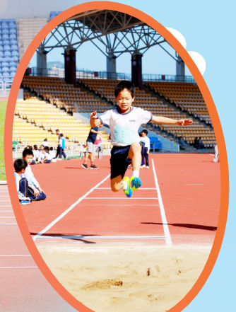
同學動作輕巧如羚羊，是否穿了彈簧鞋？