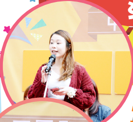
兩位學業有成的大師姐專誠回校跟師弟妹分享學習心得及校園往事。