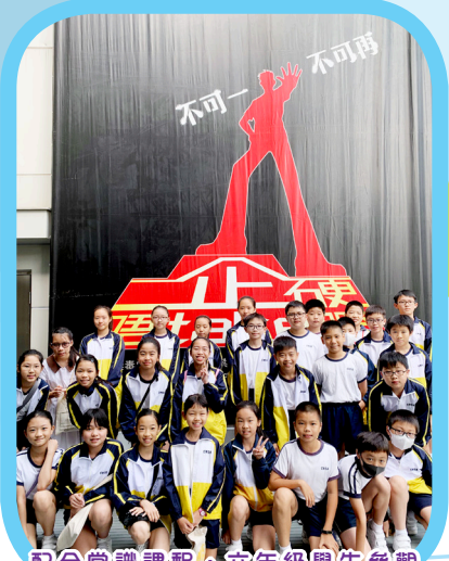
配合常識課程，六年級學生參觀「藥物資訊天地」，了解毒品的種類和禍害。