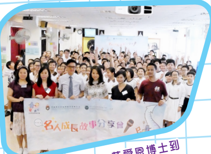
名人成長故事——高愛恩博士到校分享，給予同學鼓勵及正向人生觀。