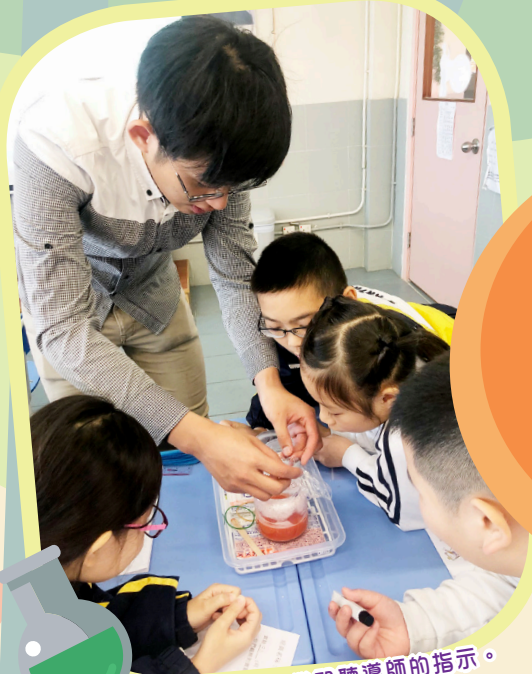
進行實驗前留心聆聽導師的指示。

目標： 透過「釣冰塊」、「水上煙花」等各種小實驗，探究「水」的特性，提升科學探究精神。