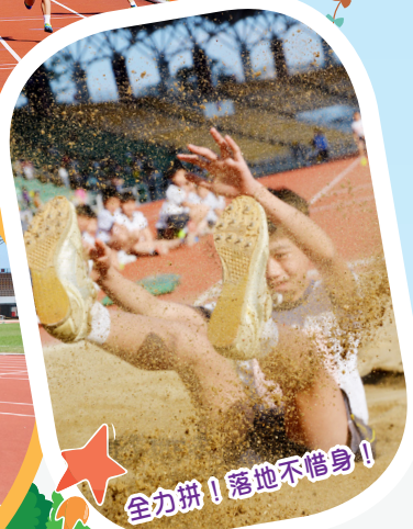
全力拼！落地不惜身！