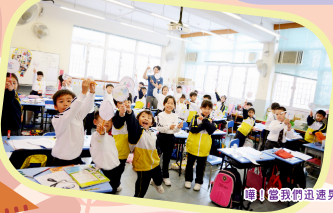
嘩！當我們迅速晃動手中的「鳥籠」，小鳥彷彿在「籠」中飛舞呢！