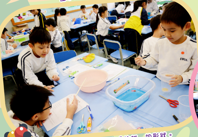
大家同心合力改良「快艇」的形狀。