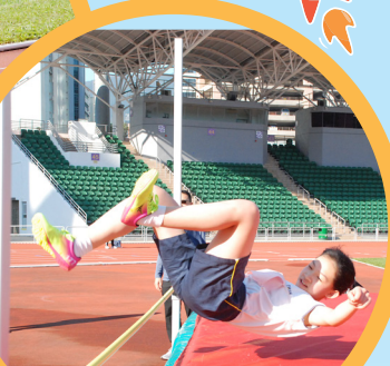
乾脆俐落！一躍而過！