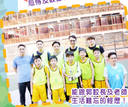
能跟郭校長及老師們一起打籃球，是校園生活難忘的經歷！能勝出更是開心呢！