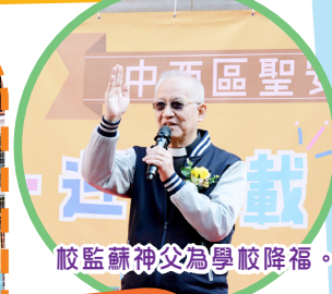
校監蘇神父為學校降福。