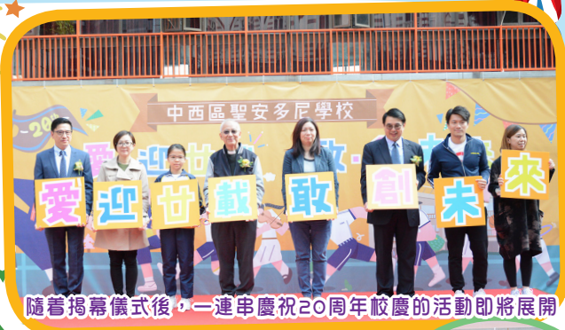
隨着揭幕儀式後，一連串慶祝20周年校慶的活動即將展開！