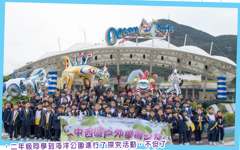
「1920中西區戶外學習之旅」，二年級同學到海洋公園進行了探究活動，不但了解了大熊貓的生長及增進了保護海洋的知識，更親手摸摸海星、海參，樂在其中。