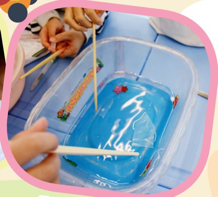
看誰的「快艇」走得快！