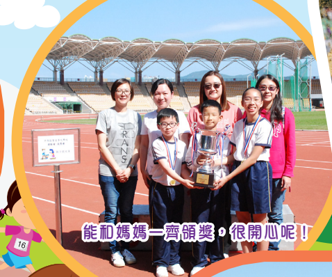
能和媽媽一齊領獎，很開心呢！