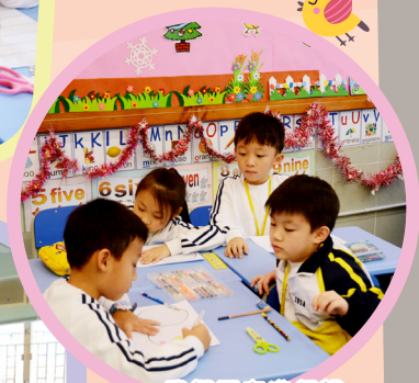
我們正在進行視覺暫留活動，在畫「籠」中的「小鳥」。