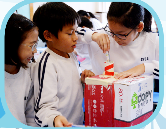
同學用心設計及製作「空氣箱」。