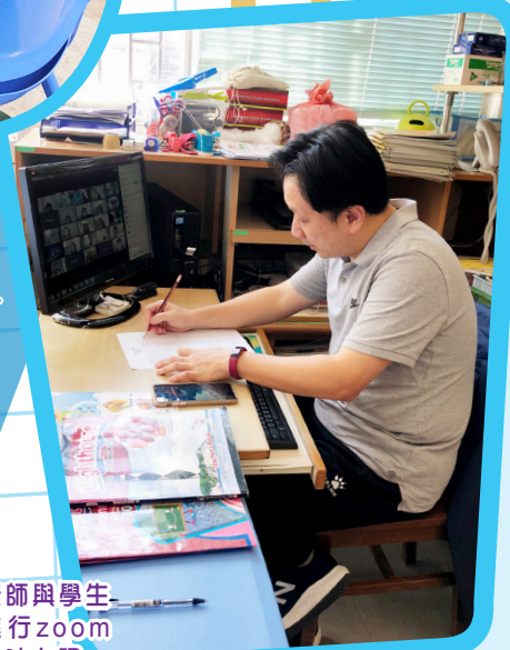
老師與學生進行zoom實時上課。

第三階段：三至六年級的中文、英文、數學、常識科進行ZOOM實時教學；而一、二年級維持上載教學短片；至於普通話、「學得樂小組」、視藝、宗教、訓輔等繼續上載學習短片。