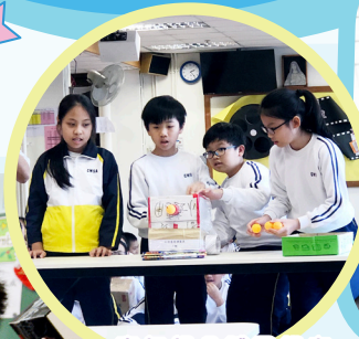
高年級全體同學在禮堂進行緊張刺激的「班際空氣箱射擊大賽」。