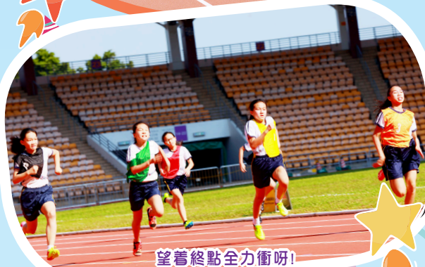
望着終點全力衝呀！