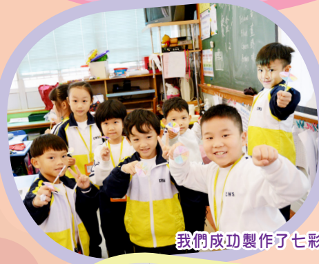
我們成功製作了七彩美麗的視錯覺紙陀螺！