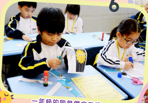
一年級的同學們非常投入製作三合一圖畫。