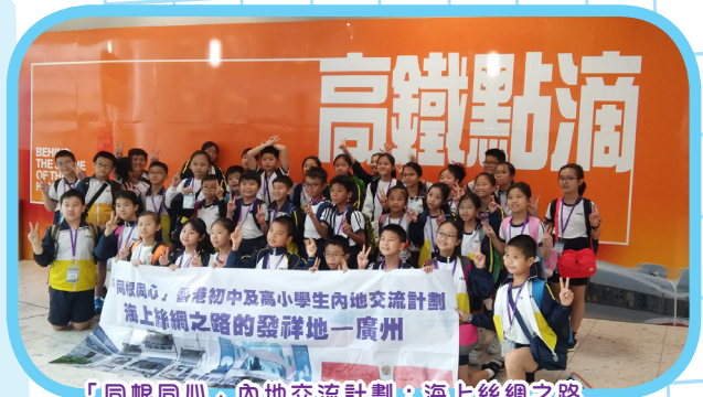
「同根同心」內地交流計劃：海上絲綢之路的發祥地——廣州高鐵路兩天之旅。學生認識廣州作為絲綢之路發祥地的歷史和文化，以及了解廣州在古今對外貿易及文化交流扮演的角色。