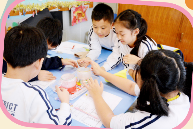
學生觀察蒸餾法淨化污水的過程。