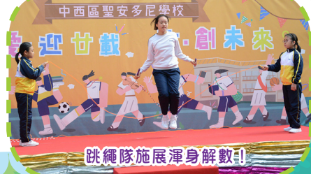
跳繩隊施展渾身解數!!