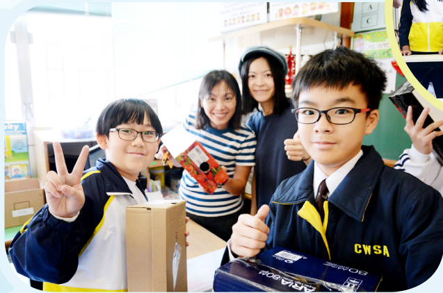
製作「空氣箱」的材料很重要，我們的成品必定很厲害！