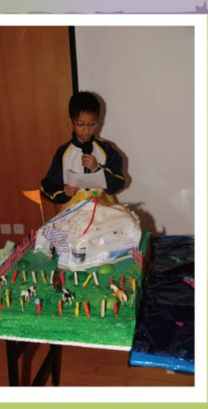
我們利用環保物料製作五星級 的家,看看我們的蒙古包,最 適合牧民居住。