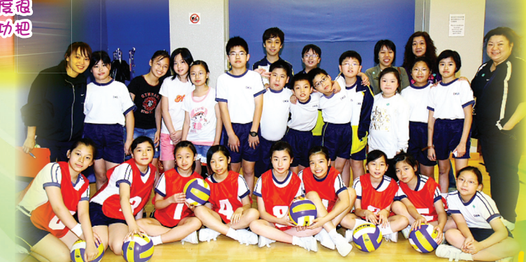
排球 磁 参加第一年 舉辦 的 港 西 區 學 界 比 書 · 先來 一 張 大 合 照 吧 !