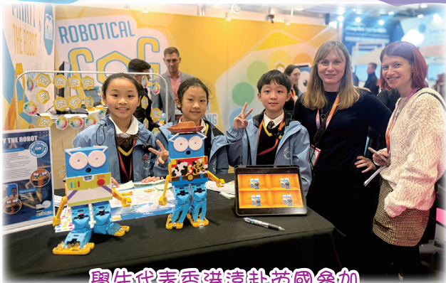
學生代表香港遠赴英國參加 Marty機械人比賽