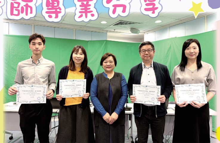
教師獲邀出席教育局小學校本課程發展組2025 「以行求知」經驗分享會