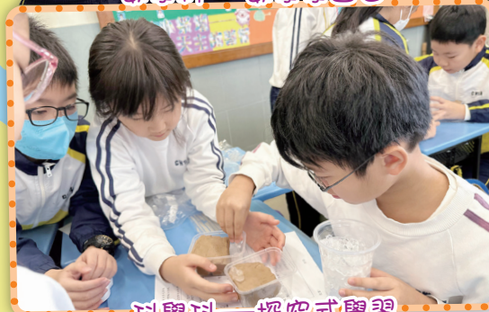
科學科—探究式學習