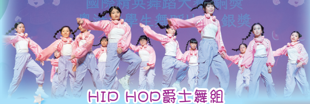
HIP HOP 爵士舞組