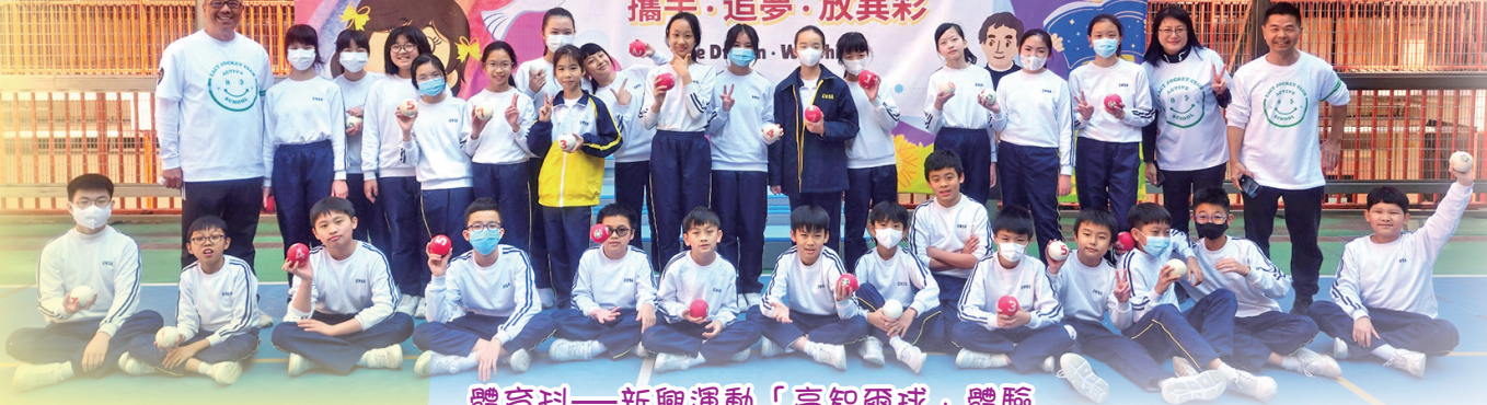
體育科—新興運動「高智爾球」體驗