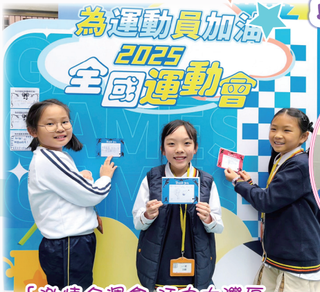
「激情全運會 活力大灣區」 為運動員打氣!