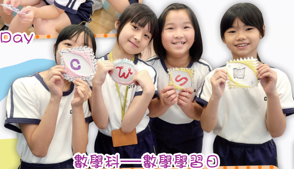
數學科—數學學習日