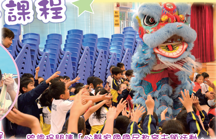
跨課程閱讀「心繫家國國民教育主題活動」