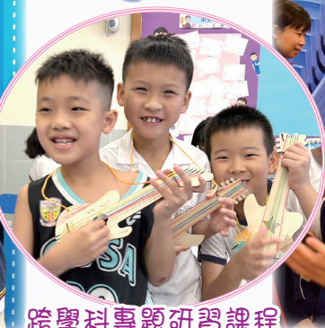
跨學科專題研習課程