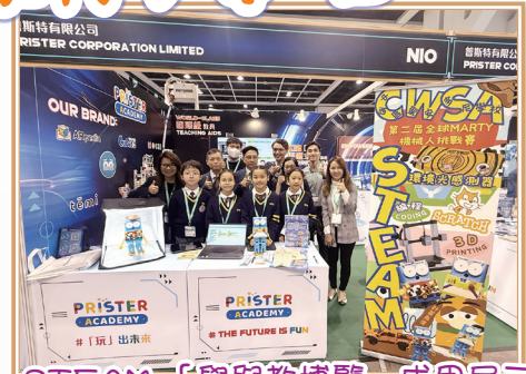
STEAM「學與教博覽」成果展示