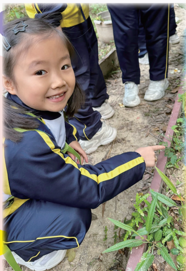
跨學科學習—美麗的社區